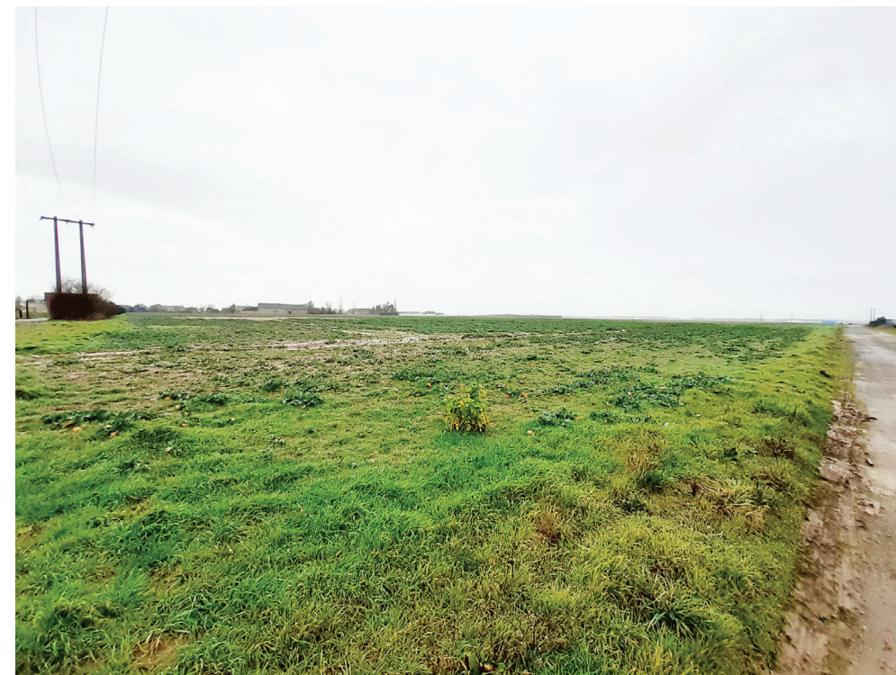
PC 07 VUE PROCHE - VUE 12 - DEPUIS LA RUE DE LA BRUYERE