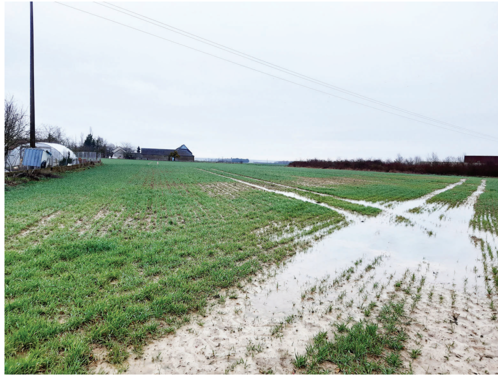
PC 07 VUE PROCHE - VUE 8 - DEPUIS LES CHAMPS