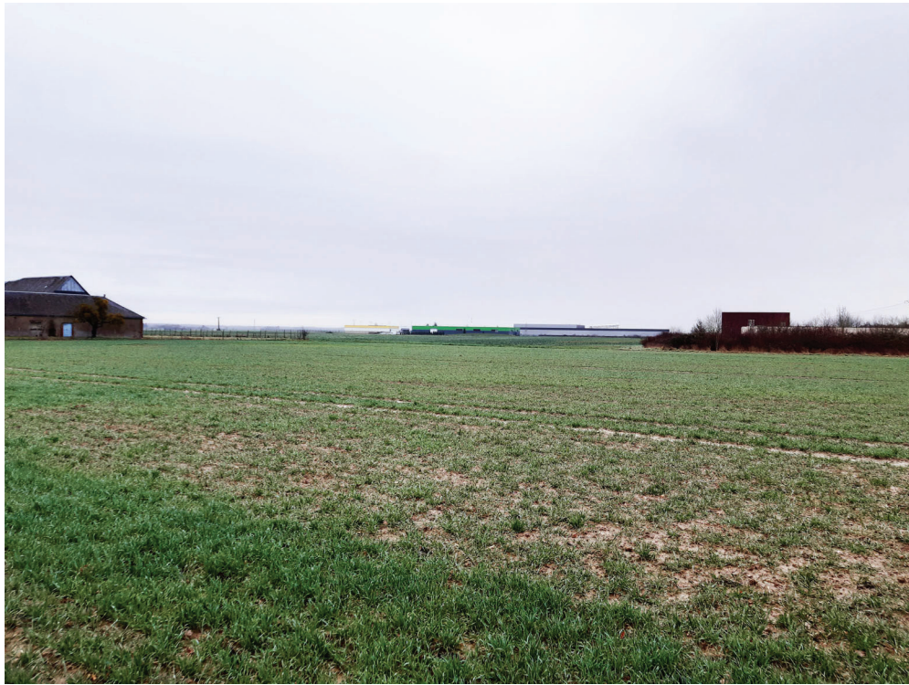
PC 07 VUE PROCHE - VUE 7 - DEPUIS LES CHAMPS