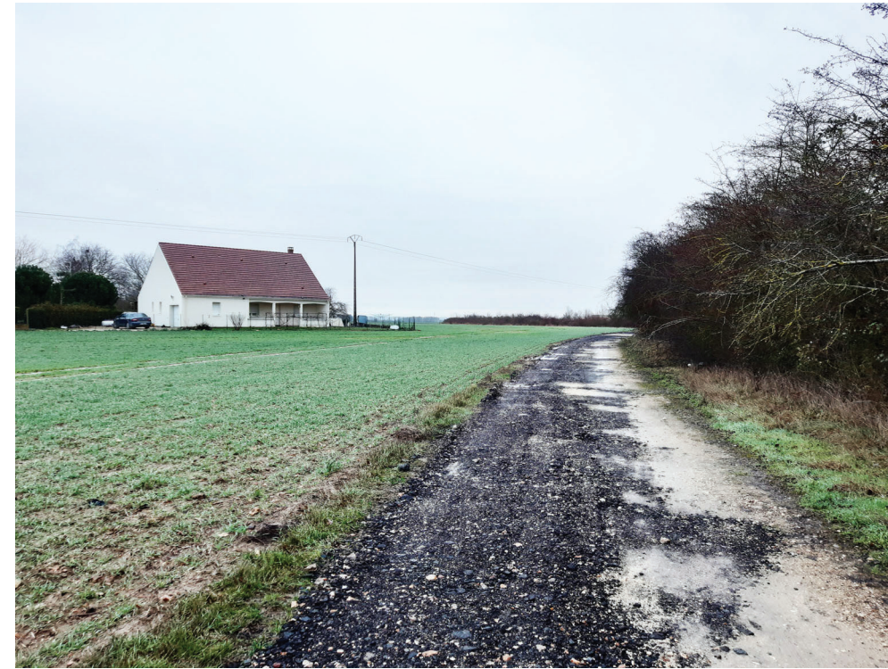
PC 08 VUE LOINTAINE - VUE 9 - DEPUIS LA CHEMIN DU CORMIER