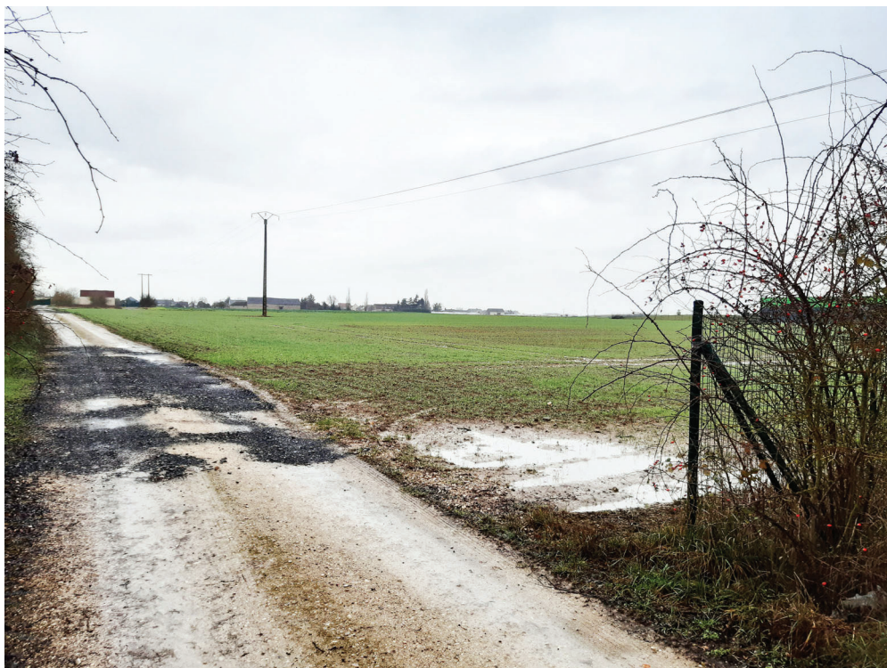
PC 08 VUE LOINTAINE - VUE 10 - DEPUIS LA RUE LOUIS APPERT