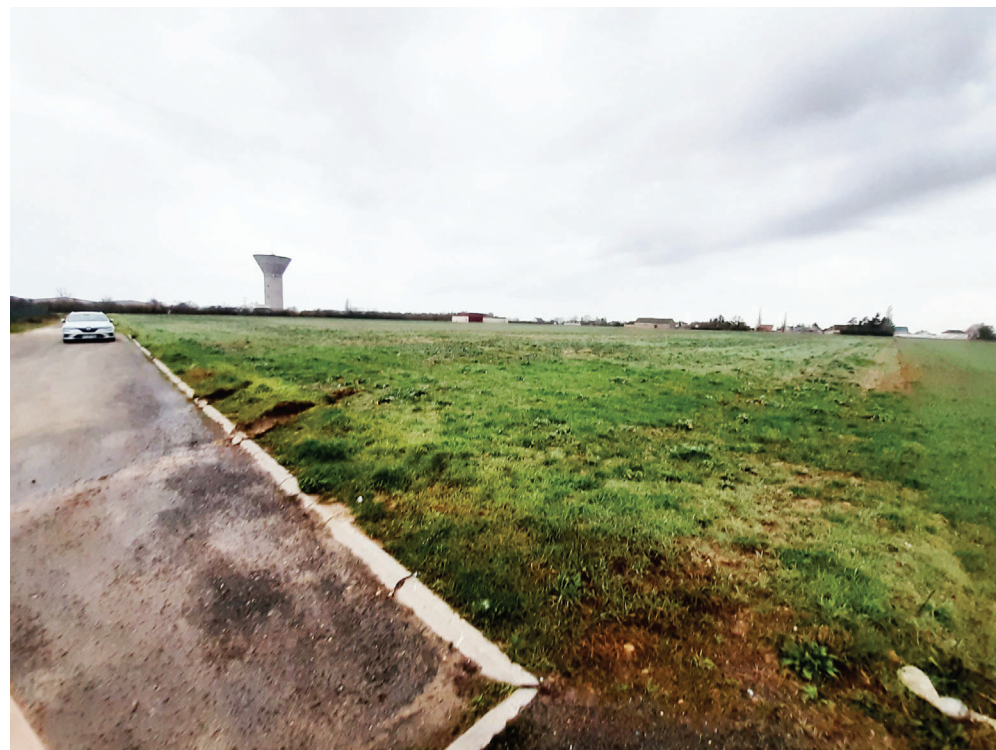
PC 07 VUE PROCHE - VUE 11 - DEPUIS LA RUE DE LA BRUYERE